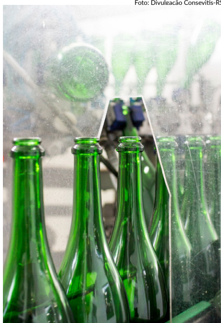
Caminhão será equipado com sistema móvel de envasamento e rotulagem

O caminhão é da categoria leve, equipado com furgão de carga seca e conta com tanque pulmão de 500 litros, conjunto de filtração móvel, enxaguadora, enchedora, rolhadora, tampador pilfer, rotuladora e capsuladora autoadesiva. A fabricação será realizada sob encomenda, com fornecimento dividido entre